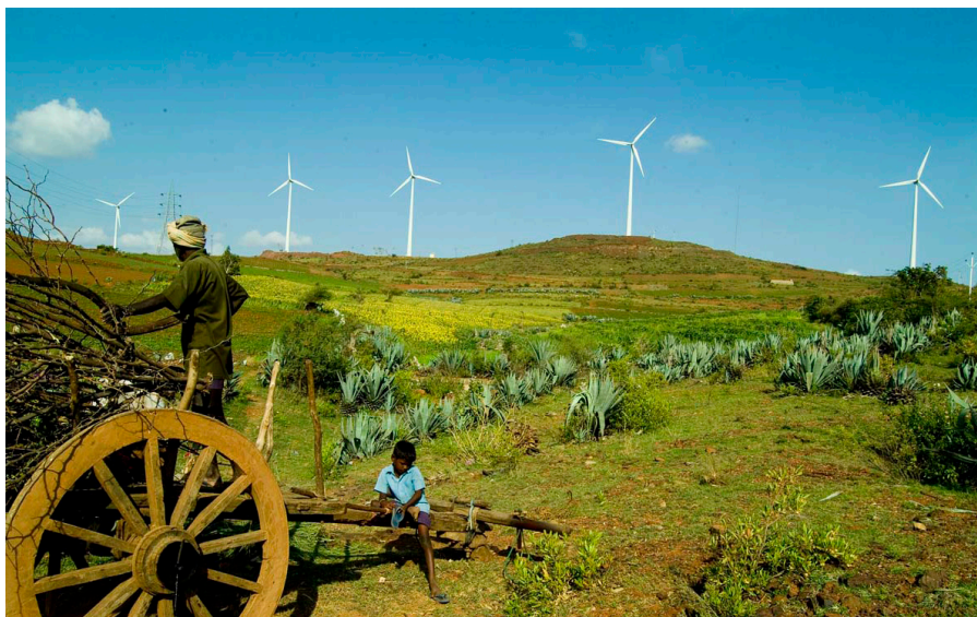
图片：印度投资数十亿安装风力发电机组，希望在未来五年内将风能体量翻一番。

包括拉贾斯坦邦和马哈拉施特拉邦在内的印度西部地区风能系统建设投资最大，在过去四十年产量减少得也最厉害，但是印度东部等其他地区的风能